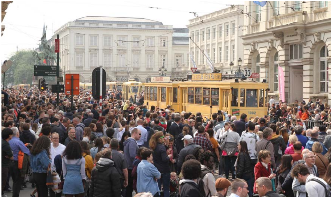
Sferbeelden van de tramparade in Brussel. Een ware mensenmassa was naar het Koningsplein en de Koningsstraat gekomen om naar de stoet oude trams te kijken.

Om de 150-ste verjaardag van deze eerste tramlijn in Brussel / in België waardig te vieren organiseerde onze Brusselse zustervereniging 'Museum Stedelijk Vervoer Brussel' een uitgebreid herdenkingsprogramma, en dit in samenwerking met het Brussels Gewest dat op hetzelfde moment zijn 30 ste verjaardag vierde. Hoogtepunt was een uitgebreide tramparade op 1 mei langs het Koningsplein, het Paleizenplein en de Koningsstraat.