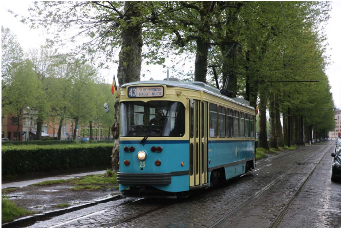
Tussen het lentegroen aan de Coupure.