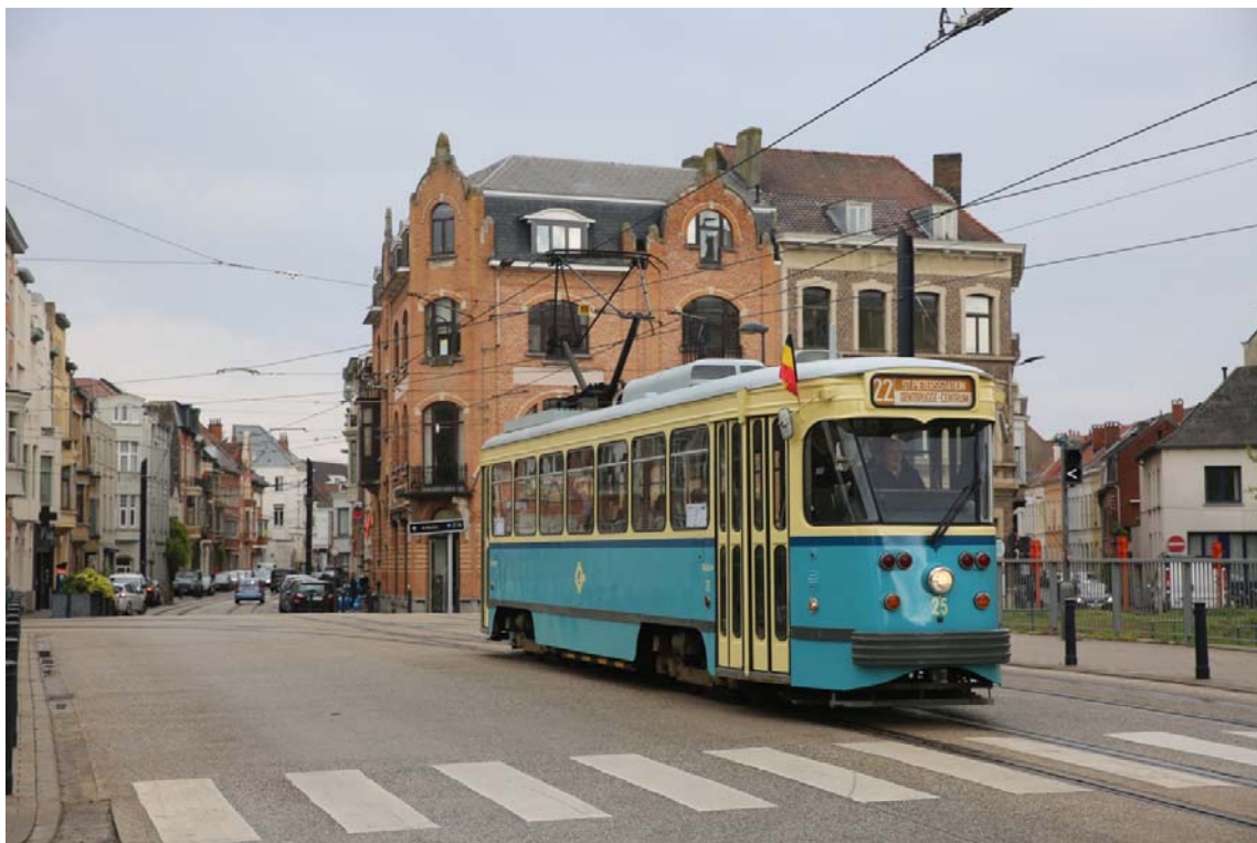
Op de Rozemarijnbrug. Voor de gelegenheid waren beide PCC's uitgerust met een bij hun blauwe livrei passende oude lijnfilm